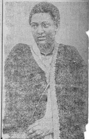
Galantería de "La Prensa Libre"

These lion'smane fellows are splendid to look at and most impressive in photographs, but rather difficult neighbors when one must sit for hours between two of them. The skin worn by one of this pair surely came from a